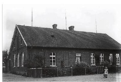
Die frühere Volksschule in Hahlen mit dem Anbau. Das Bild stammt aus dem Jahr 1948.